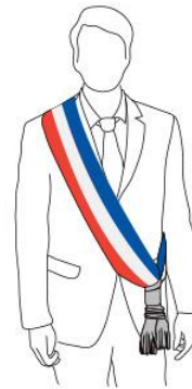
Adjoint au maire